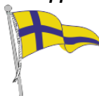
Circolo Velico Stabia